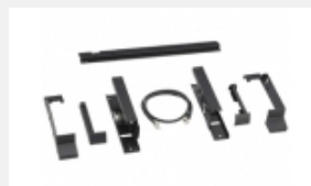
BKM-37H Base di supporto con funzione di inclinazione per fissare l'unità di controllo monitor BKM-16R ai monitor di riferimento BVM- E250/F250 da 25 pollici.