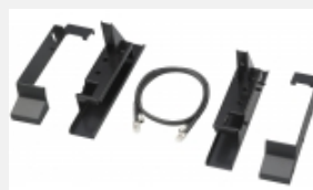
BKM-38H Base di supporto per fissare l'unità di controllo monitor BKM-16R ai monitor di riferimento BVM-E250/F250 da 25 pollici.