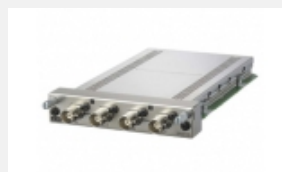
BKM-250TG Adattatore di ingresso 3G/HD/SD-SDI