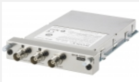
BKM-220D Adattatore di ingresso 4:2:2 SDI