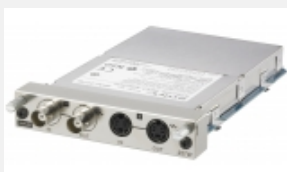
BKM-227W Adattatore di ingresso NTSC / PAL per i monitor LMD