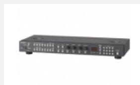
BKM-16R Unità di controllo monitor