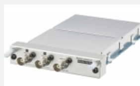
BKM-244CC Adattatore per sottotitoli HD/SDI