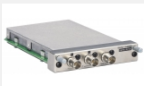
BKM-243HS Adattatore di ingresso SDI 4:2:2/HDS DI