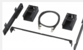
BKM-39H Base di supporto dell'unità di controllo