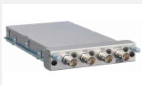
BKM-229X Adattatore di ingresso component per i monitor LMD